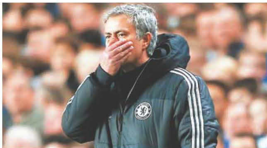
Οι μεγαλοστομίες είναι ένα από τα χαρακτηριστικά του Μουρίνιο αλλά για κάθε αλαζόνα υπάρχει πάντα κάποιος που θα του κλείσει το στόμα

Βαθμολογία (29 αγ.): Τσέλσι (28 αγ.) 64, Σίτι 58, Αρσενάλ 57, Γιουνάιτεντ 56.