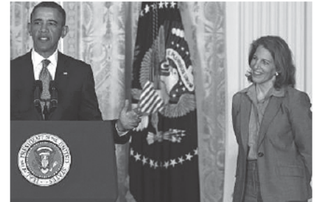
ΗΠΑ: Η ελληνικής καταγωγής υπουργός Υγείας πρόσωπο της χρονιάς

Η τελετή θα πραγματοποιηθεί στο Λας Βέγκας στις 22 Απριλίου, 2015. Η CinemaCon, είναι ένα ετήσιο γεγονός που συγκεντρώνει ιδιοκτήτες κινηματογράφων από όλο τον κόσμο, καθώς και σκηνοθέτες, παραγωγούς και άλλα ονόματα του Χόλιγουντ, υψηλού προφίλ, προκειμένου να μοιραστούν την πρόσφατη πρόοδο, στην κινηματογραφική τεχνολογία.