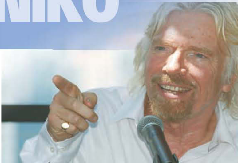
Ο ΕΚΚΕΝΤΡΙΚΟΣ ΔΙΣΕΚΑΤΟΜΜΥΡΙΟΥΧΟΣ Ρίτσαρντ Μπράνσον ανακοίνωσε ότι η εταιρεία του Virgin Galactic, που θα προσφέρει ταξίδια στο Διάστημα, δέχεται από τώρα πληρωμές και κρατήσεις θέσεων σε Bitcoins