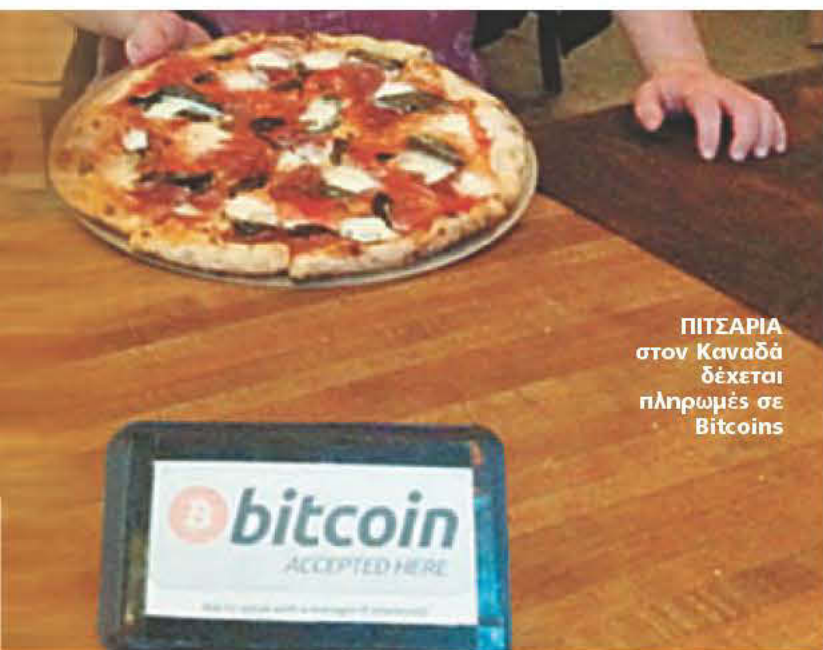
ΠΙΤΣΑΡΙΑ στον Καναδά δέχεται πληρωμές σε Bitcoins

γκουρού του Διαδικτύου έφτασε σήμερα να αποτελεί τη νέα μανία της διεθνούς κοινότητας. Σχεδόν τέσσερα χρόνια μετά την παρουσίασή του, το Bitcoin κατάφερε να ξεπεράσει τα όρια του Ιντερνετ και να καταλάβει -κυριολεκτικά και μεταφορικά- την πραγματική οικονομία.