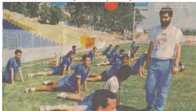
Ο Φερνάντο Σάντος προπονει τους παίκτες της Εστορίλ (1991)

Ο Φερνάντο Σάντος προτού διαπρέψει στην προπονητική ως ο απόλυτος μετρ της τακτικής, εργαζόταν σε ξενοδοχειακή μονάδα. Άλλωστε το 1977 πήρε το πτυχίο του ως ηλεκτρολόγος-μηχανικός. Ο γεννημένος στο Εστορίλ άλλωστε δεξιός μπακ ξεκίνησε την προπονητική καριέρα του, το 1987. Ήταν 34 ετών όταν πραγματοποιούσε τα πρώτα του βήματα ως τεχνικός στην ομάδα της γενέτειρας του.