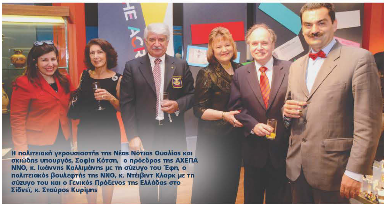
Η πολιτειακή γερουσιαστής της Νέας Νότιας Ουαλίας και σκιώδης υπουργός, Σοφία Κότση, ο πρόεδρος της ΑΧΕΠΑ ΝΝΟ, κ. Ιωάννης Καλλιμάνης με τη σύζυγο του Έφη, ο πολιτειακός βουλευτής της ΝΝΟ, κ. Ντέιβιντ Κλαρκ με τη σύζυγο του και ο Γενικός Πρόεδρος της Ελλάδας στο Σίδνεϊ, κ. Σταύρος Κυρίμης