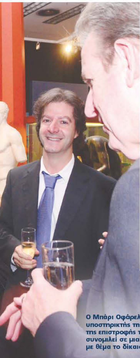
Ο Μπάρι Οφάρελ, υποστηρικτής της υπόθεσης της επιστροφής των Γλυπτών συνομιλεί σε μια συντροφιά με θέμα το δίκαιο αίτημα