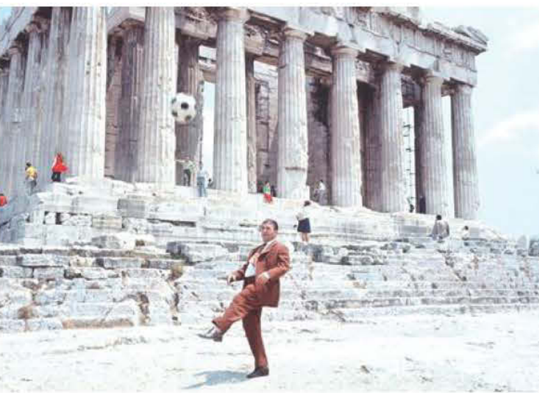
Ο Πούσκας παίζει με μια μπάλα με φόντο τον Παρθενώνα (1970).

αριστερό πόδι πραγματικό κεραυνό, με μια απίστευτη ποικιλία στον εκτελεστικό τομέα. Αποσύρθηκε από την ενεργό δράση τον Ιούνιο του 1966. Είναι φυσικά ο μεγαλύτερος σκόρερ όλων των εποχών στην Ευρώπη και ένας από τους κορυ-