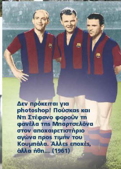
Δεν πρόκειται για photoshop! Πούσκας και Ντι Στέφανο φορούν τη φανέλα της Μπαρτσελόνα στον αποχαιρετιστήριο αγώνα προς τιμήν του Κουμπάλα. Άλλες εποχές, άλλα ήθη... (1961)