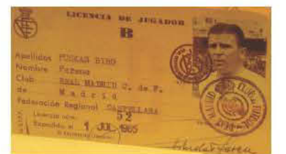
Το δελτίο του Πούσκας με την Ρεάλ Μαδρίτης

Στη συνέχεια εργάστηκε ως τεχνικός σε διάφορες ομάδες (πέρασε και από τις 5 ηπείρους), όμως η μεγαλύτερη επιτυχία στην προπονητική του καριέρα ήρθε στον Πανα-