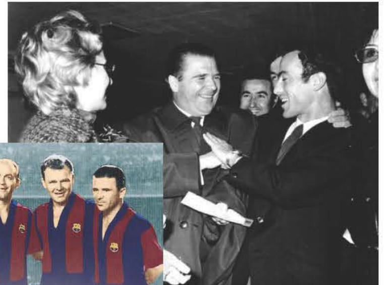
Ο Πούσκας μαζί με τον Μίμη Δομάζο και τη Βίκυ Μοσχολιού στην επιστροφή του Παναθηναϊκού από την Αγγλία μετά το ισόπαλο 1-1 με την Έβερτον για τα προημιτελικά του Κυπέλλου Πρωταθλητριών (9/3/1971).