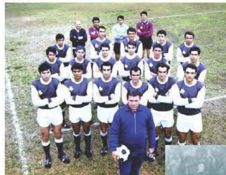
Ο Πούσκας με την ομάδα του Παναθηναϊκού που αντιμετώπισε τον Άγιαξ στον τελικό του Κυπέλλου Πρωταθλητριών (2/6/1971).

Ο Πούσκας ολοκλήρωσε την ποδοσφαιρική του καριέρα έχοντας πετύχει 512 τέρματα σε 528 αγώνες πρωταθλήματος (Ουγγαρία και Ισπανία). Συνολικά, σε όλες τις διοργανώσεις σε συλλόγους και στην Εθνική, ο «Πάντσο» σημείωσε 704 γκολ σε 716 επίσημες συμμετοχές. Κοντός και γεμάτος, μπορεί να μη γέμιζε το μάτι, αλλά διέθετε ένα