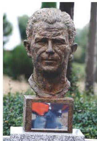
Η προτομή του Φέρεντς Πούσκας που τοποθετήθηκε στην είσοδο του προπονητικού κέντρου της Ρεάλ Μαδρίτης, στο Βαλντεμπέμπας, στις 23 Οκτωβρίου του 2013.