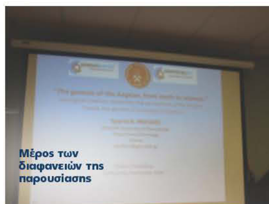
Μέρος των διαφανειών της παρουσίας