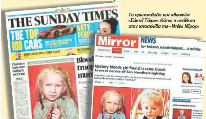
Το πρωτοσέλιδο των χθεσινών «Σάντεϊ Τάιμς». Κάτω: η υπόθεση στην ιστοσελίδα της «Ντέιλι Μίρορ»