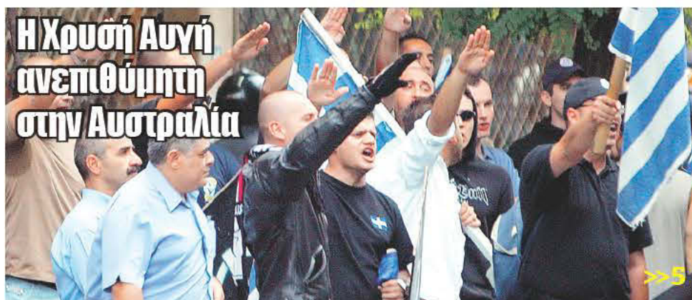
Η Χρυσή Αυγή ανεπιθύμητη στην Αυστραλία