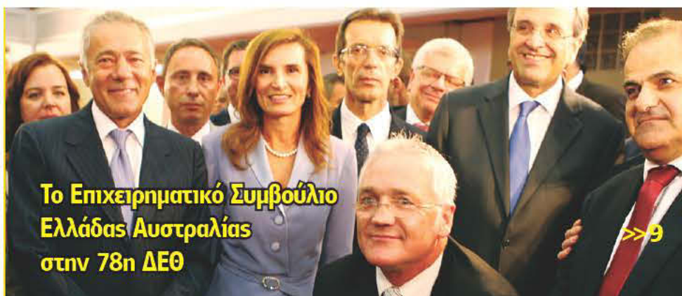
Το Επιχειρηματικό Συμβούλιο Ελλάδας Αυστραλίας στην 78η ΔΕΘ

HELLENIC MEDIA PTY LTD • Phone (02)9568 3766 • Fax: (02) 9569 9344 • E-mail: kosmos@kosmos.com.au Address: 503-507 Marrickville Rd, Dulwich Hill, NSW 2203 • Price: $2.00 (GST inclusive) / QLD, N.T., S.A., W.A. $2.50