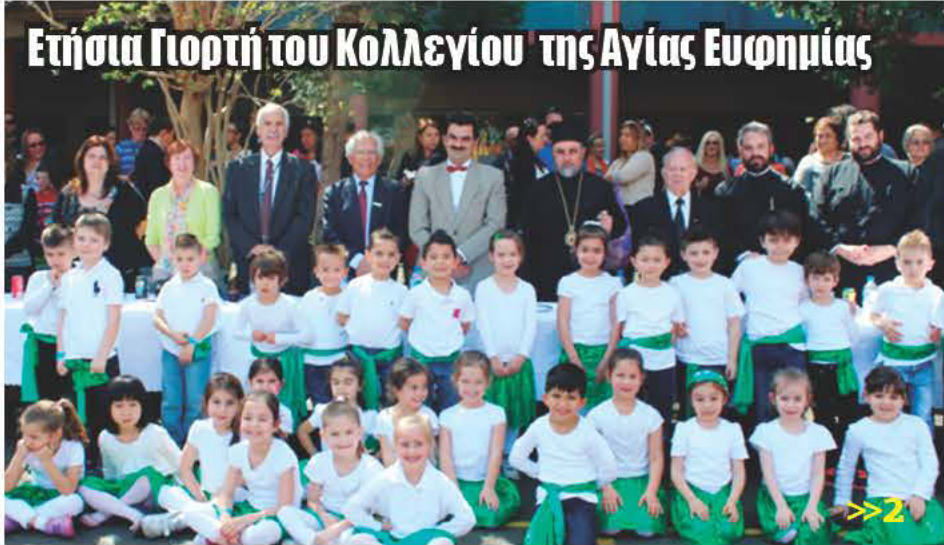
Ετήσια Γιορτή του Κολλεγίου της Αγίας Ευφημίας

HELLENIC MEDIA PTY LTD • Phone (02)9568 3766 • Fax: (02) 9569 9344 • E-mail: kosmos@kosmos.com.au Address: 503-507 Marrickville Rd, Dulwich Hill, NSW 2203 • Price: $2.00 (GST inclusive) / QLD, N.T., S.A., W.A. $2.50