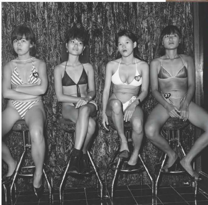
Girls, Crush Velvet Lounge, Pattaya, Thailand