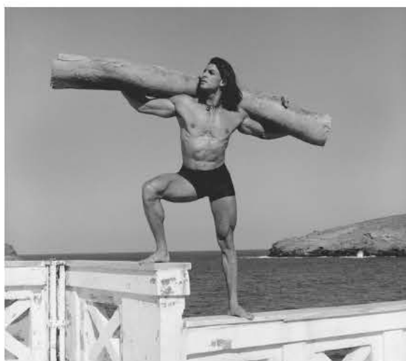
Andreas 2, Andros, Greece