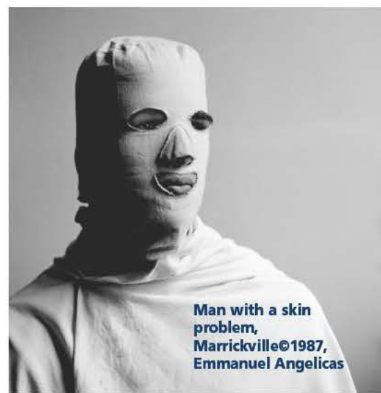
Man with a skin problem, Marrickville