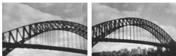
Οι δύο πρώτες φωτογραφίες που τραβήξε ο Emmanuel Angelicas, στην ηλικία των επτά ετών.