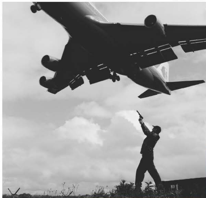
Urban terrorist, Marrickville

Μεγαλώνοντας στο Μάρικβιλ δεν ήταν εύκολη υπόθεση. Η ανάγκη εξερεύνησης του κόσμου πέρα από τα όρια της οικογένειας και των φίλων φάνταζε συναρπαστική. Έγινα πιο τολμηρός και πήρα περισσότερα ρίσκα. Άρχισα να φωτογραφίζω ανθρώπους που δεν γνώριζα. Ήταν μια εποχή που οι μετανάστες μόλις που είχαν αρχίσει να γίνονται αποδεκτοί. Η πείρα που είχα αποκτήσει στο σχολείο του δρόμου με βοήθησε να αποκτήσω αυτοπεποίθηση. Αγκάλιασα την περιοχή και τους ανθρώπους και ξέρω πως σήμερα κάθε φορά που περπατάω στους δρόμους του τόπου που μεγάλωσα, μέρα ή νύχτα, η φωτογραφία είναι εκεί και με περιμένει. Όλα αυτά τα χρόνια φωτογράφισα Ξανά και Ξανά ανθρώπους που κάποτε ήταν νέοι και τώρα είναι ηλικιωμένοι. Νομίζω ότι οι καλλιτέχνες πολλές φορές απομακρύνονται από το άμεσο περιβάλλον τους με στόχο την αναζήτηση ενός νέου ερεθίσματος. Με μένα συμβαίνει το αντίθετο. Κάθε πρωί που ξυπνώ στο Μάρικβιλ, βλέπω κάτι καινούργιο, έστω κι αν είναι εδώ που έχω ζήσει το μεγαλύτερο μέρος της ζωής μου.