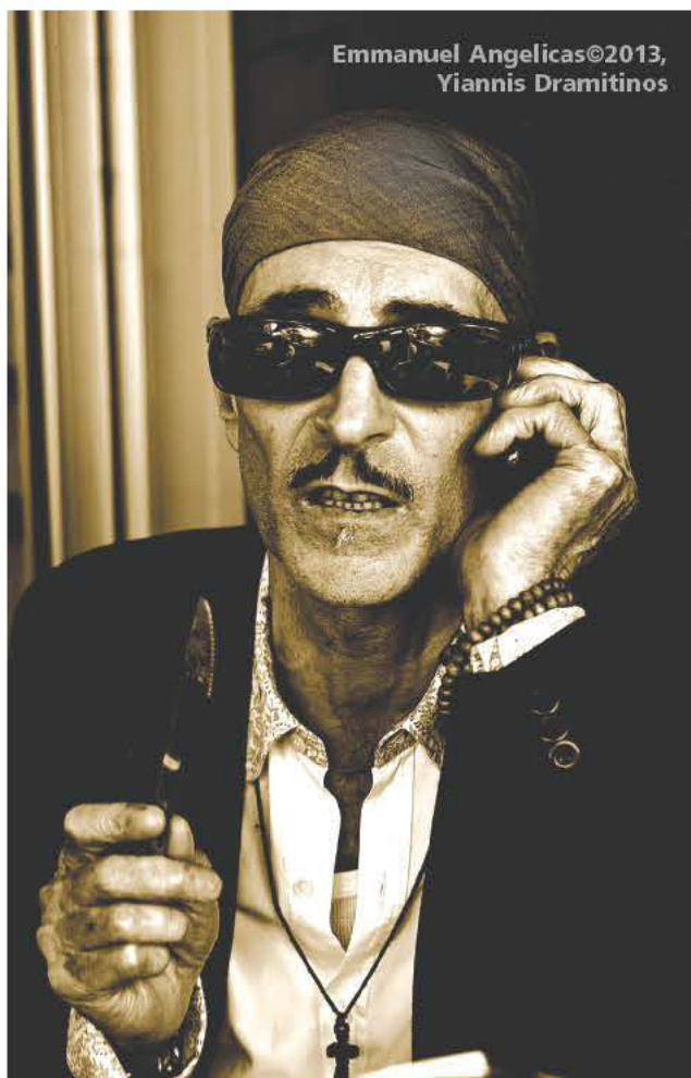
Emmanuel Angelikas©2013, Yiannis Dramitinos

Τώρα Ξέρω. Δεν ήταν ο Αγγελίκας που μίλησε για τις φωτογραφίες του. Ήταν οι φωτογραφίες που μίλησαν και εμείς για μια στιγμή υποψίασθήκαμε το άρρητο μυστικό τους.