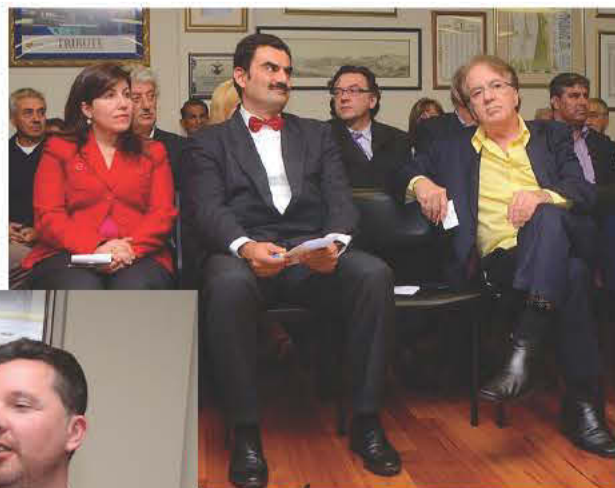
Ιδιαίτερα εκτιμήθηκε η παρουσία του Γ. Προξένου, Σταύρου Κυρίμη, στην τελετή της ΑΧΕΠΑ - μια από τις πρώτες δημόσιες εμφανίσεις του νέου διπλωματικού εκπροσώπου της Ελλάδος στο Σύννευ.

νεργασία της νέας προέδρου και του νέου προέδρου κατά την διάρκεια της θητείας τους. Και το γεγονός ότι ο κ. Καλλιμάνης διαδέχεται τον κ. Γ. Θεοδωρίδη, δηλώνοντας δημοσίως ότι θα επιθυμούσε την συμπάρταση του προ-