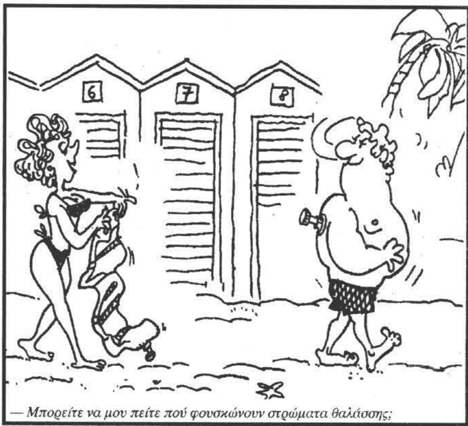
— Μπορείτε να μου πείτε πού φουσκώνουν στρώματα θαλάσσης;