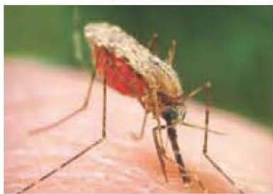
Κώνωψ ο ανωφελής (ο φορέας της ελονοσίας)