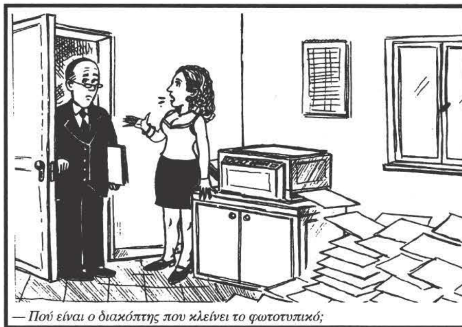
— Πού είναι ο διακόπτης που κλείνει το φωτοτυπικό;

10 ... Ο' Νιλ: μπασκετμπολίστας — Γάλλος ποιητής, ο αρχηγός της Πλειάδας. 11 Λεπτότητα πνεύματος (αρχ. μτφ.) — Σταθμός καμηλιέρηδων — Βουβή... δίκη. 12 Χειροπιαστές — Η ηθοποιός Τόμσον — Σχετικά με τον τουρισμό αρχικά. 13 Βάναυσα αυτά — Ξαλάφρωμα, ξεκούραση (μτφ.).