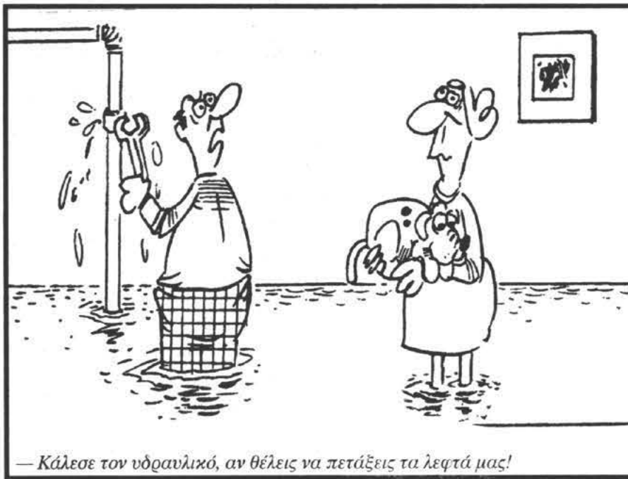
— Κάλεσε τον υδραυλικό, αν θέλεις να πετάξεις τα λεφτά μας!