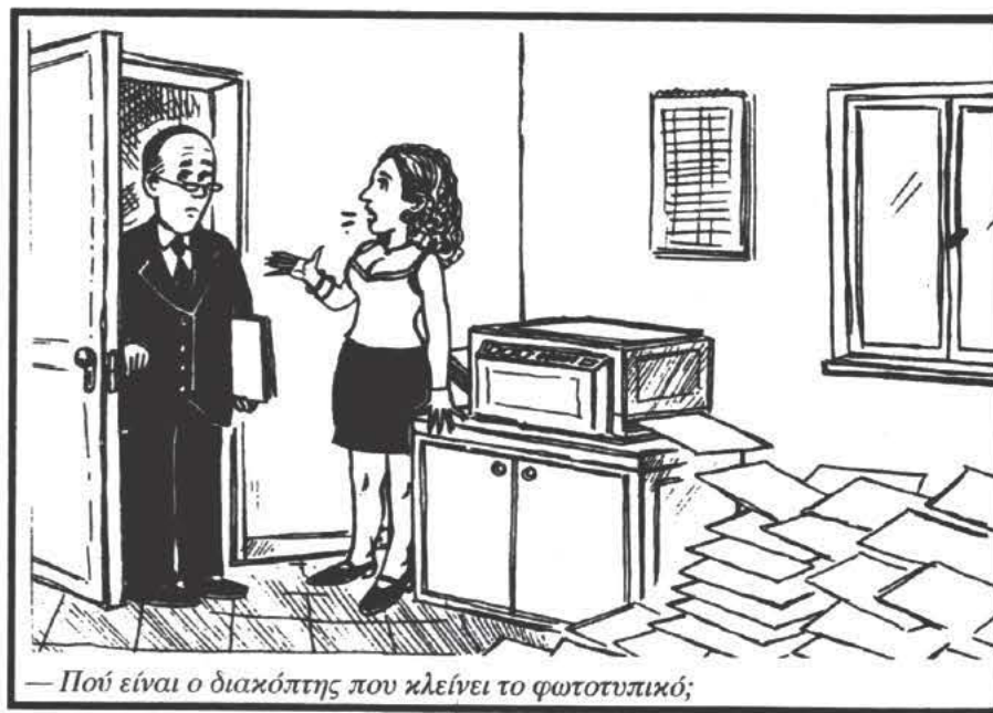
— Πού είναι ο διακόπτης που κλείνει το φωτοτυπικό;

10 ... Ο' Νιλ: μπασκετμπολίστας — Γάλλος ποιητής, ο αρχηγός της Πλειάδας. 11 Λεπτότητα πνεύματος (αρχ. μτφ.) — Σταθμός καμηλιέρηδων — Βουβή... δίκη. 12 Χειροπιαστές — Η ηθοποιός Τόμσον — Σχετικά με τον τουρισμό αρχικά. 13 Βάναυσα αυτά — Ξαλάφρωμα, ξεκούραση (μτφ.).