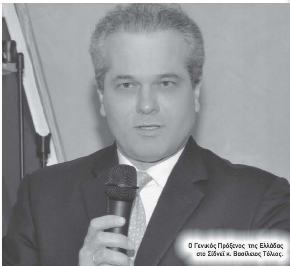
Ο Γενικός Πρόξενος της Ελλάδας στο Σίδνεϊ κ. Βασίλειος Τόλιος.