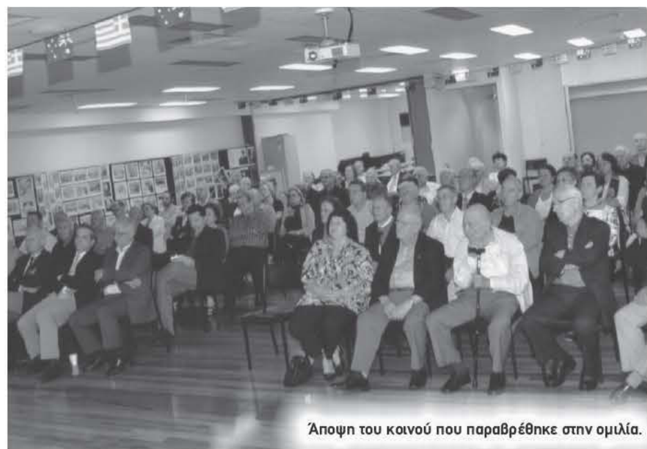
Άποψη του κοινού που παραβρέθηκε στην ομιλία.