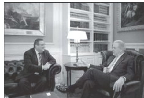
ΤΟΝΙΣΤΗΚΕ Ο ΣΗΜΑΝΤΙΚΟΣ ΡΟΛΟΣ ΤΗΣ ΟΜΟΓΕΝΕΙΑΣ