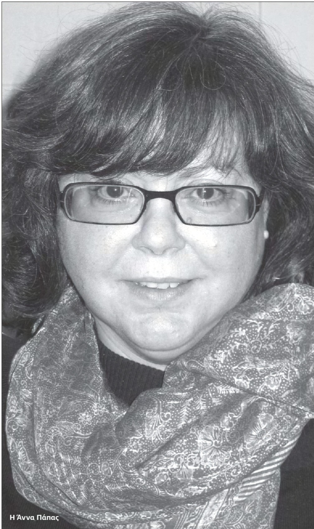
Η Άννα Πάπας

Η ιδιαιτερότητα του συνδέσμου έγκειται στο ότι η σύγχρονη τέχνη που προωθεί, μέσω των γκαλερί-μελών, είναι εκείνη των καλλιτεχνών που ζουν και είναι ενεργοί.