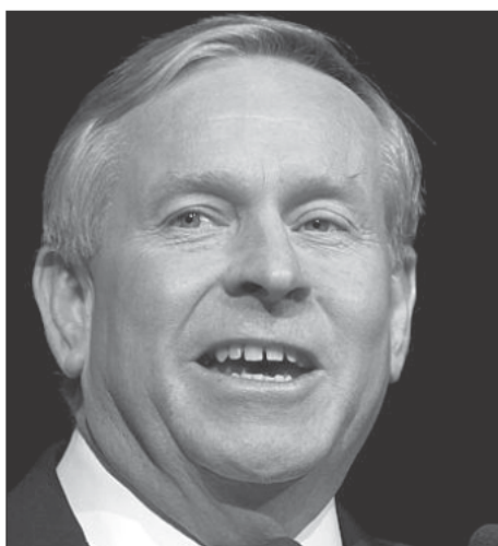
Ο πρωθυπουργός της Δυτικής Αυστραλίας, Κόλιν Μπαρνέτ.

Η κυβέρνηση Συνασπισμού του Κόλιν Μπαρνέτ στη Δυτική Αυστραλία, συνεχίζει να προηγείται του Εργατικού Κόμματος στις δημοσκοπήσεις και μάλιστα με μεγάλη διαφορά, σύμφωνα με τα αποτελέσματα τελευταίας δημοσκόπησης που διενήργησε στην Πολιτεία η εταιρία Νιούσπολ. Συγκεκριμένα, η κυβέρνηση Μπαρνέτ απολαμβάνει την υποστήριξη του 49% των ψηφοφόρων, έναντι του 30% που υποστηρίζουν το Εργατικό Κόμμα. Μετά την καταμέτρηση των ψήφων προτίμησης, ο Συνασπισμός Φιλελεύθερων-Εθνικών συγκεντρώνει το 58% των ψήφων, έναντι του 42% που συγκεντρώνει η πολιτειακή αντιπολίτευση. Να σημειωθεί ότι οι επόμενες εκλογές στην πολιτεία θα διεξαχθούν στις 9 Μαρτίου.