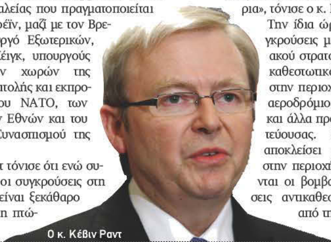
Ο κ. Κέβιν Ραντ

Την ίδια ώρα, πάντως, συγκρούσεις μεταξύ του συριακού στρατού και των αντικαθεστωπικών μαίνονται στην περιοχή γύρω από το αεροδρόμιο της Δαμασκού και άλλα προάστια της πρωτεύουσας. Ο στρατός έχει αποκλείσει την πρόσβαση στην περιοχή ενώ συνεχίζονται οι βομβαρδισμοί σε θέσεις αντικαθεστωπικών γύρω από τη Δαμασκό.