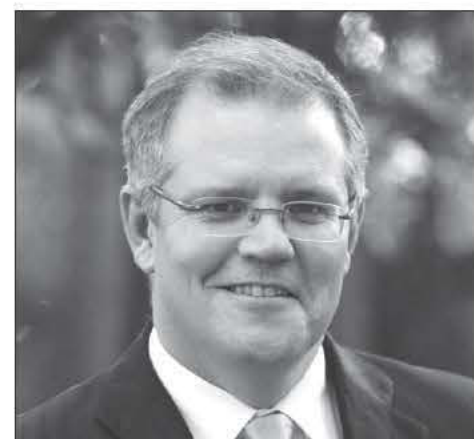
Ο σκωτς υπ. Μετανάστευσης, Σκοτ Μόρισον.

Ο κ. Μόρισον υπογράμμισε ότι το πρόβλημα της λαθρομετανάστευσης μπορεί να καταπολεμηθεί μόνο αν η κυβέρνηση υποχρεώνει τα σκάφη που καταφθάνουν στα χωρικά ύδατα της Αυστραλίας να επιστρέφουν στις χώρες προέλευσής τους και