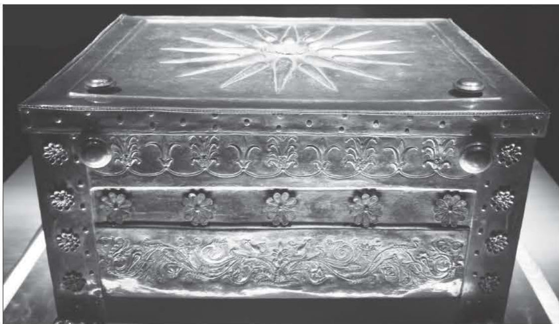
Η λάρνακα που βρέθηκε στον τύμβο περιείχε το λείψανο του βασιλιά και ένα περίφημο χρυσό διάδημα