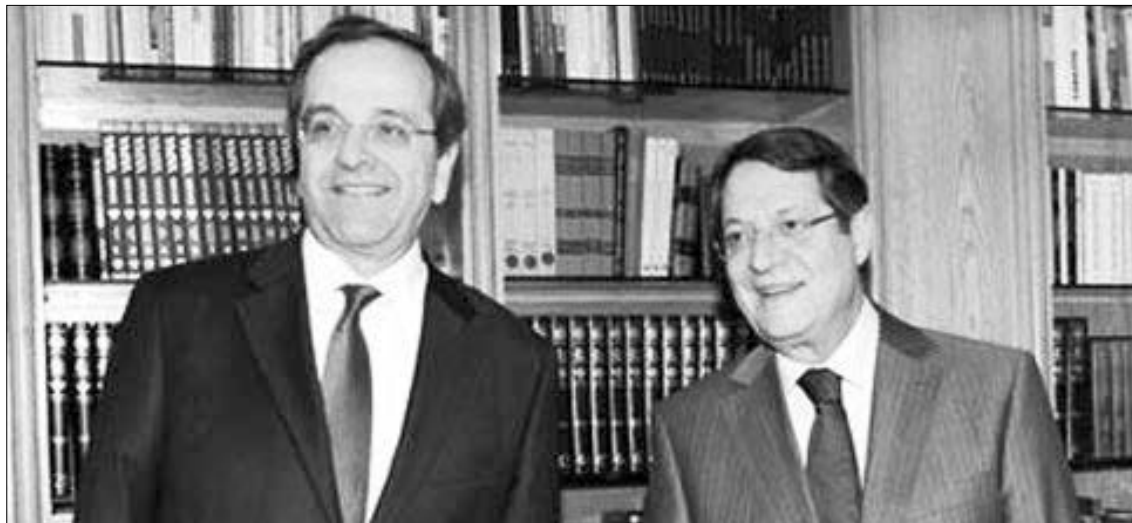
Ο Νίκος Αναστασιάδης με τον πρωθυπουργό της Ελλάδας Αντώνη Σαμαρά.

ΣΥΝΑΝΤΗΣΕΙΣ ΣΤΗΝ ΑΘΗΝΑ ΚΑΙ ΜΕ ΠΑΠΟΥΛΙΑ ΚΑΙ ΜΕΪΜΑΡΑΚΗ