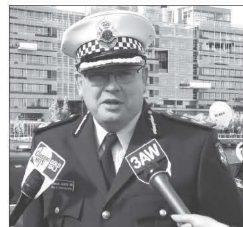
Ο υπαρχηγός της Αστυνομίας της Βικτώριας, Γκράχαμ Άστον

«Δημιουργήσαμε την πρώτη διακομματική επιτροπή διερεύνησης καταγγελιών για σεξουαλικές κακοποιήσεις ανηλίκων στη Βικτώρια. Ήταν ένα πολύ σημαντικό βήμα. Οι σοβαρές καταγγελίες που έγιναν στην επιτροπή αυτή και το ενδιαφέρον που προκάλεσε, οδήγησαν στη συγκρότηση Βασιλικής Εξεταστικής Επιτροπής από την κοινοπολιτειακή κυβέρνηση. Δεν γνωρίζουμε ακόμη τους όρους εντολής της υπό συγκρότηση επιτροπής. Μέχρι να ανακοινωθούν το χρονοδιάγραμμα, οι όροι εντολής και η σύνθεση της Βασιλικής Εξεταστικής Επιτροπής, η διακομματική επιτροπή της Πολιτείας μας θα συνεχίσει να συγκεντρώνει στοιχεία για σεξουαλικές κακοποιήσεις παιδιών στην Πολιτεία», απάντησε για το θέμα ο πρωθυπουργός της Βικτώριας, Τεντ Μπέιλιου, κατά τη διάρκεια συνέντευξης Τύπου.