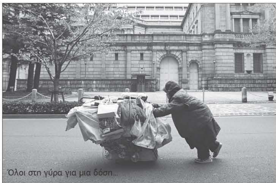
Όλοι στη γύρα για μια δόση...