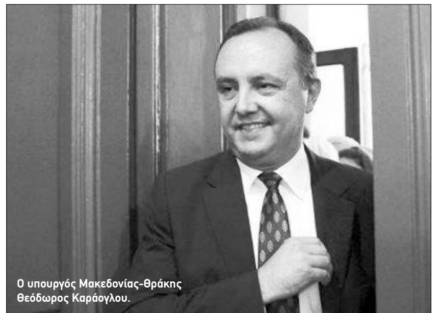
Ο υπουργός Μακεδονίας-Θράκης Θεόδωρος Καραόγλου.

«Με την παρουσία μας εδώ, προσδοκούμε να δημιουργηθεί μια μόνιμη γέφυρα οικονομικής και επιχειρηματικής σχέσης της Βόρειας Ελλάδας με την Αυστραλία, δίνοντας, παράλλη-