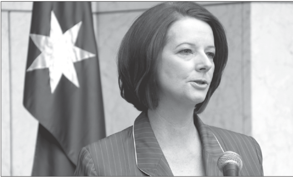
Η πρωθυπουργός Τζούλια Γκίλαρντ.