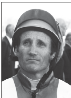
Ο Ντάμιεν Όλιβερ

Με κατηγορίες για παράνομα στοιχήματα, επιβαρύνεται ο αναβάτης που κέρδισε την προηγούμενη βδομάδα το Μέλμπουρν Καπ, Ντάμιεν Όλιβερ. Δημοσιογραφικές πληροφορίες αναφέρουν ότι αν ο 40χρονος βρεθεί ένοχος στις κατηγορίες που τον επιβαρύνουν, τότε θα τιμωρηθεί με αποβολή 8 έως 12 μηνών από τους ιππόδρομους. Οι κατηγορίες που τον επιβαρύνουν σχετίζονται με ένα στοιχήμα $10,000 που φέρεται ότι έβαλε σε άλογο το οποίο έτρεχε στην ίδια κούρσα μ' αυτόν. Οι ίδιες πληροφορίες αναφέρουν ότι ο Όλιβερ ήδη έχει ομολογήσει την ενοχή του στις κατηγορίες αυτές.