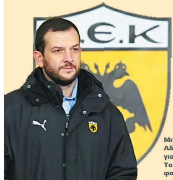
Μη φοβάσαι Αδαμίδη τα γιαούρτια... Το Εύλο να φοβάσαι!