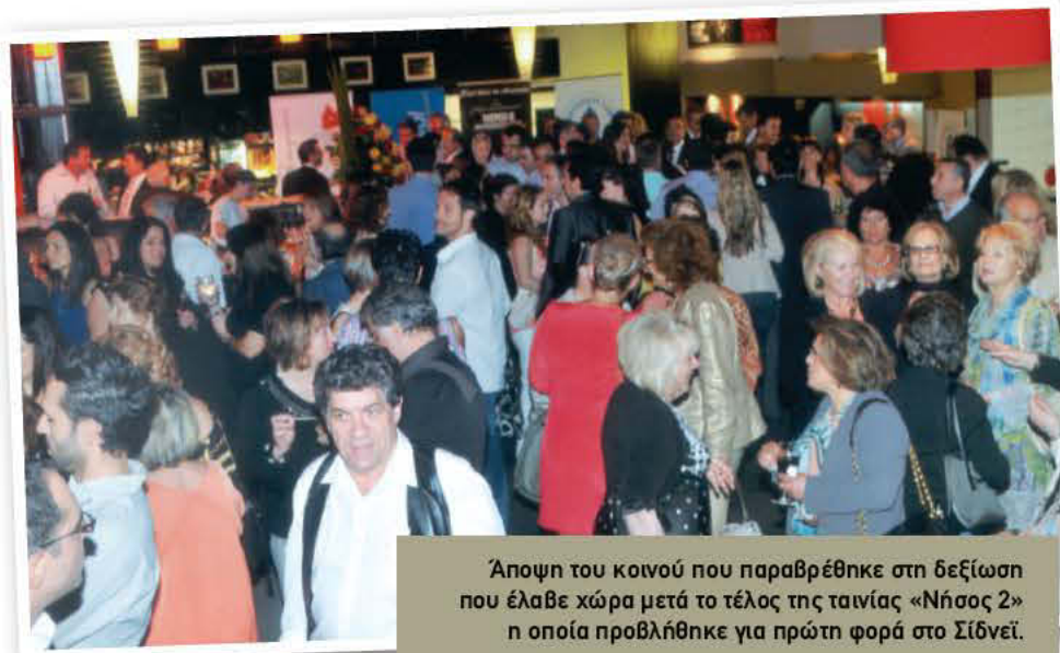
Άποψη του κοινού που παραβρέθηκε στη δεξίωση που έλαβε χώρα μετά το τέλος της ταινίας «Νήσος 2» η οποία προβλήθηκε για πρώτη φορά στο Σίδνεϊ.