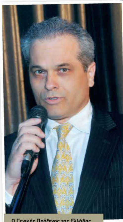
Ο Γενικός Πρόξενος της Ελλάδας στο Σίδνεϊ κ. Βασίλειος Τόλιος.