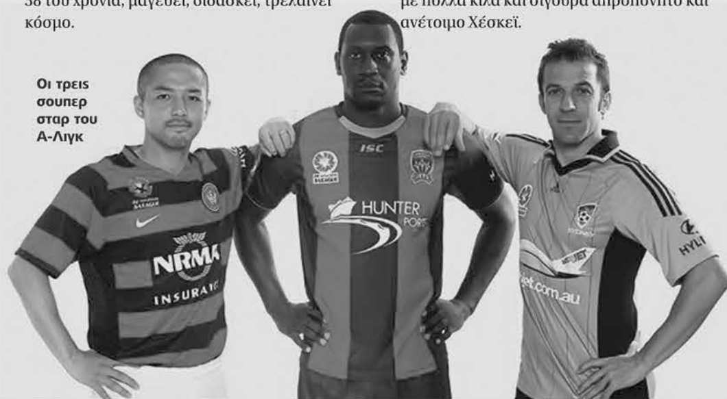
Οι τρεις σούπερ σταρ του Α-Λιγκ

Shinji Ono και Emile Heskey... Σχεδόν το ίδιο ισχύει και για τον γαπωνέζο Σίντζι Ονο που στο μικρό χρονικό διάστημα που αγωνίστηκε έδειξε ότι και αυτός είναι «πολύς» για τον υποβαθμισμένο ποδοσφαιρικό πρωτάθλημα της Αυστραλίας. Ταχύς, ευέλικτος και καλή πρώτη μπαλιά, βλέπει γήπεδο, αλλά και αυτός είναι απελπιστικά μόνος. Δύσκολο να συνηθιστεί με τον κροάτη εισαγόμενο επιθετικό Ντίνο Κρέσινγκερ, που η παρουσία του στον πρώτο αγώνα δεν έπεισε για τα χρήματα που δαπανήθηκαν για αυτόν. Ο τρίτος της παρέας των Marquees ποδοσφαιριστών του Α-Λιγκ, ο κεντρικός επιθετικός Εμιλ Χέσκει που είχε μια πολύ καλή πορεία στο Αγγλικό Πρέμιερ Λιγκ, το ντεμπούτο του με την φανέλα των Τζετς, μάλλον ήταν απογοητευτικό. Ίσως αυτό να οφείλεται και στην λάθος εκτίμηση του τεχνικού του Νιούκαστλ, Βαν Έγκμοντ, που έριξε στην μάχη τον βαρύ, με πολλά κιλά και σίγουρα απροπόνητο και ανέτοιμο Χέσκει.