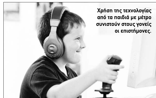
Χρήση της τεχνολογίας από τα παιδιά με μέτρο συνιστούν στους γονείς οι επιστήμονες.

Οι επιστήμονες κατέθεσαν στην Αυστραλιανή Εταιρεία Ψυχολογίας μια έκθεση όπου υπογραμμίζουν συγκεκριμένα την αύξηση που παρατηρείται τα τελευταία χρόνια στον