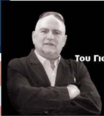
Του Γιώργου Σταυρούλακη

Του Γιώργου Σταυρούλακη sportseditor@kosmos.com.au