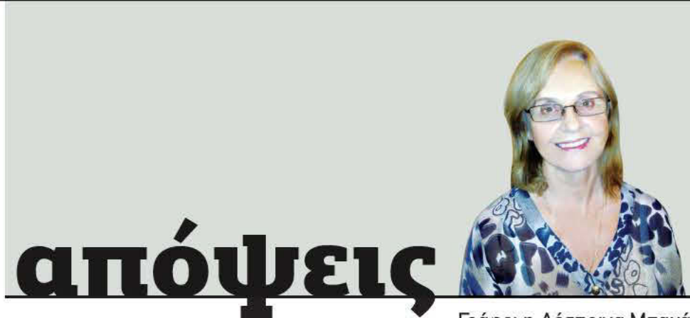
Γράφει η Δέσποινα Μπαχά

ΔΕΝ ΥΠΑΡΧΕΙ η παραμικρή αμφιβολία ότι οι καιρικές συνθήκες σε ολόκληρο τον Πλανήτη έχουν αλλάξει. Τα τελευταία χρόνια