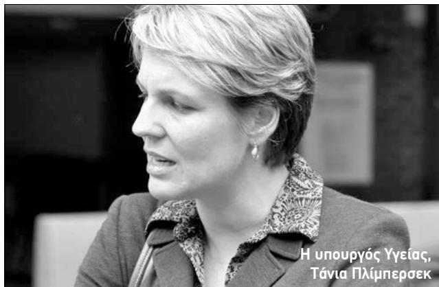
Η υπουργός Υγείας, Τάνια Πλίμπερσεκ

Σ φοδρή επίθεση κατά της καπνοβιομηχανίας Imperial Tobacco για το «κακόγουστο σλόγκαν» που χρησιμοποιεί σε τελευταία διαφημιστική της εκστρατεία, άσκησε χθες η υπουργός Υγείας, Τάνια Πλίμπερσεκ.