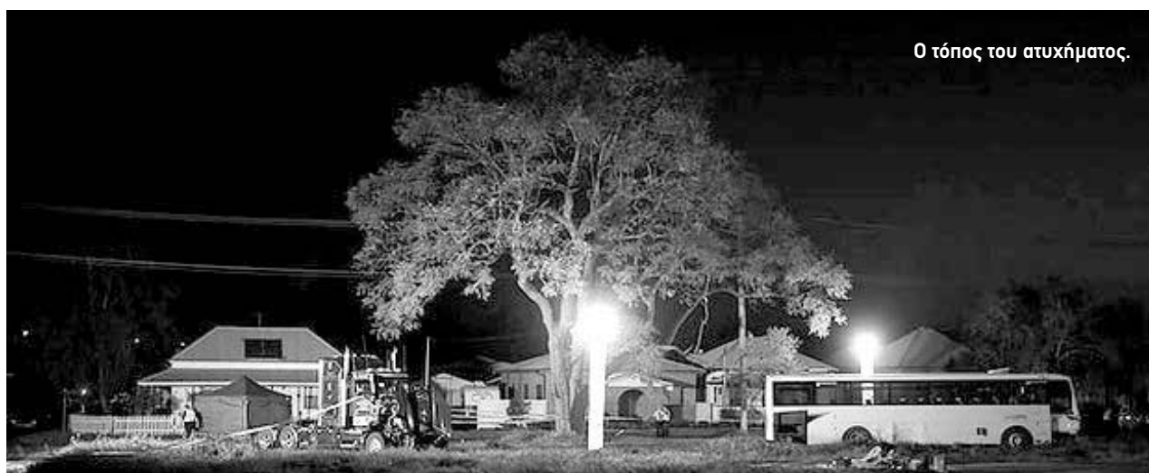
Ο τόπος του ατυχήματος.

Ο 76χρονος αφέθηκε ελεύθερος με εγγύηση και πρόκειται να παρουσιαστεί στο Δικαστήριο του Σάθερλαντ τον επόμενο μήνα.