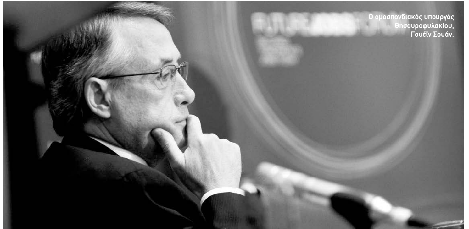
Ο ομοσπονδιακός υπουργός Θησαυροφυλακίου, Γουέιν Σουάν.

Στο μεταξύ, δημοσιογραφικές πληροφορίες ανέφεραν χθες ότι η Αποθεματική Τράπεζα βρίσκεται ενώπιον δύσκολων αποφάσεων στην περίπτωση που η αυστραλιανή οικονομία χρειαστεί να αποφύγει μια ραγδαία επιβράδυνση εξαιτίας του περιορισμού των επενδύσεων στην μεταλλευτική βιομηχανία. Αυτό αναφέρεται σε άρθρο γνώμης του ανεξάρτητου οικονομολόγου Ed Shann στην εφημερίδα Herald Sun, όπου τονίζεται ότι τα επιτόκια θα χρειαζόταν να πέσουν σημαντικά εάν η ανάπτυξη, που συνδέεται κυρίως με την μεταλλευτική βιομηχανία, μειωθεί ενώ την ίδια στιγμή η ανάπτυξη των υπολοίπων τομέων θα πρέπει να επιταχυνθεί δραστικά ώστε να αποφευχθεί η ύφεση. «Εάν μάλιστα», σημειώνει ο Ed Shann, «όπως αναμέ-