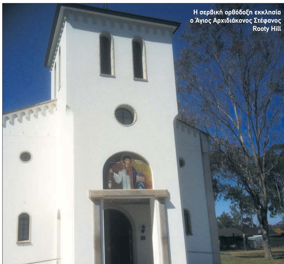
Η σερβική ορθόδοξη εκκλησία ο Άγιος Αρχιδιάκονος Στέφανος Rooty Hill

Η φετινή γιορτή εντάχθηκε στα πλαίσια των μακράς διάρκειας Μακεδονικών Εκδηλώσεων «Δημήτρια 2012» που ξεκίνησαν στα μέσα Αυγούστου, για τα 100 χρόνια της απελευθέρωσης της Δυτικής Μακεδονίας και της Θεσσαλονίκης με αποκορύφωμα την έναρξη της έκθεσης για τον Μακεδόνα στρατηλάτη Μέγα Αλέξανδρο στο Μουσείο «Australian Museum» στο κεντρικό Σίδνεϊ τον προσηχή Νοέμβριο. Παρών ήταν ο πρό-