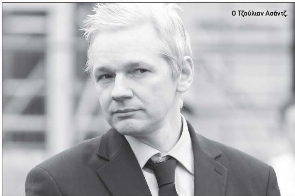
Ο Τζούλιαν Ασάντζ.

Οι συνομιλίες με το Λονδίνο σχετικά με την τύχη του Αυστραλού ιδρυτή του WikiLeaks, Τζούλιαν Ασάντζ, «θα επαναληφθούν εντός των ημερών», επιβεβαίωσε προχθές ο υπουργός Εξωτερικών του Ισημερινού Ρικάρντο Πατίνιο. Ο Πατίνιο αντέδρασε με τη δήλωση αυτή στην έκκληση του Βρετανού ομολόγου του, του Ουίλιαμ Χέιγκ, ο οποίος κάλεσε το Κίτο σε νέες συζητήσεις «το συντομότερο δυνατόν». Ο Πατίνιο υπογράμμισε πως ο ίδιος ο πρόεδρος του Ισημερινού, Ραφαέλ Κορέα, είχε δηλώσει πως θα επαναλάβει το διάλογο για τον Ασάντζ. «Συνεπώς θα το πράξουμε απτές τις μέρες», πρόσθεσε ο υπουργός.