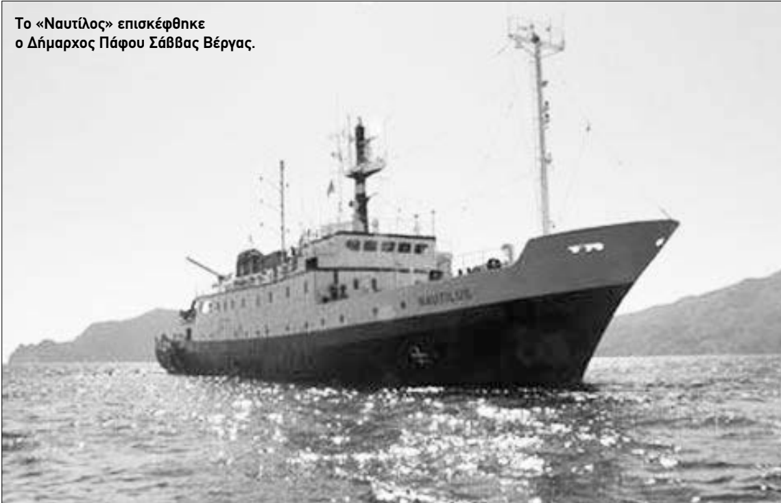
Το «Ναυτίλος» επισκέφθηκε ο Δήμαρχος Πάφου Σάββας Βέργας.