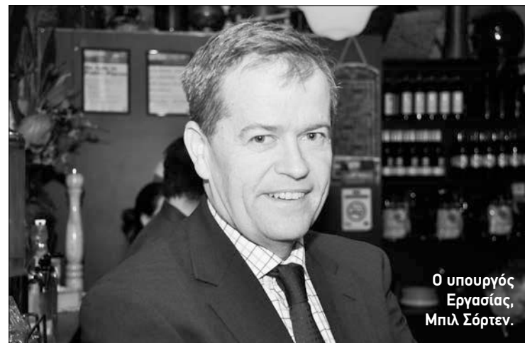
Ο υπουργός Εργασίας, Μπιλ Σόρτεν.

Επιτροπή της Γερουσίας εξετάζει την πρόταση για αύξηση του επιδόματος, μετά τις πιέσεις που άσκησαν οι οργανώσεις Anglicare Australia, Salvation Army, UnitingCare Australia