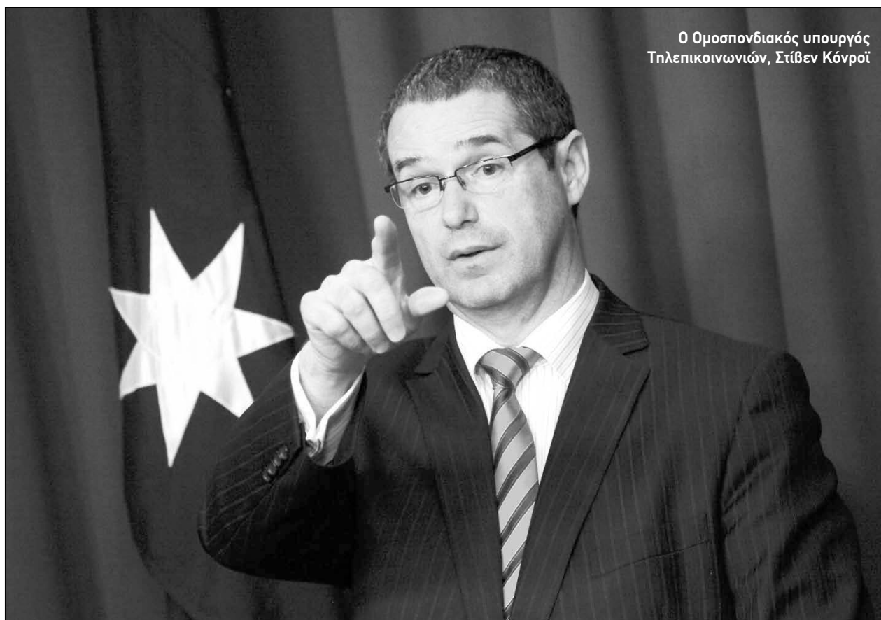
Ο Ομοσπονδιακός υπουργός Τηλεπικοινωνιών, Στίβεν Κόνροϊ

οκτώ σπίτια νοτιοδυτικά του Σίδνεϊ απ' όπου και κατάσχασαν 5 κιλά ηρωΐνης και περισσότερα από $200,000 σε χαρτονομίσματα. Συνέλαβαν δε τέσσερις άνδρες και δύο γυναίκες. Οι κατηγορούμενοι προφυλακίστηκαν μέχρι να γίνει η δίκη τους.