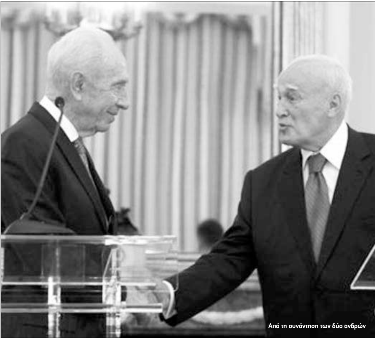
Από τη συνάντηση των δύο ανδρών