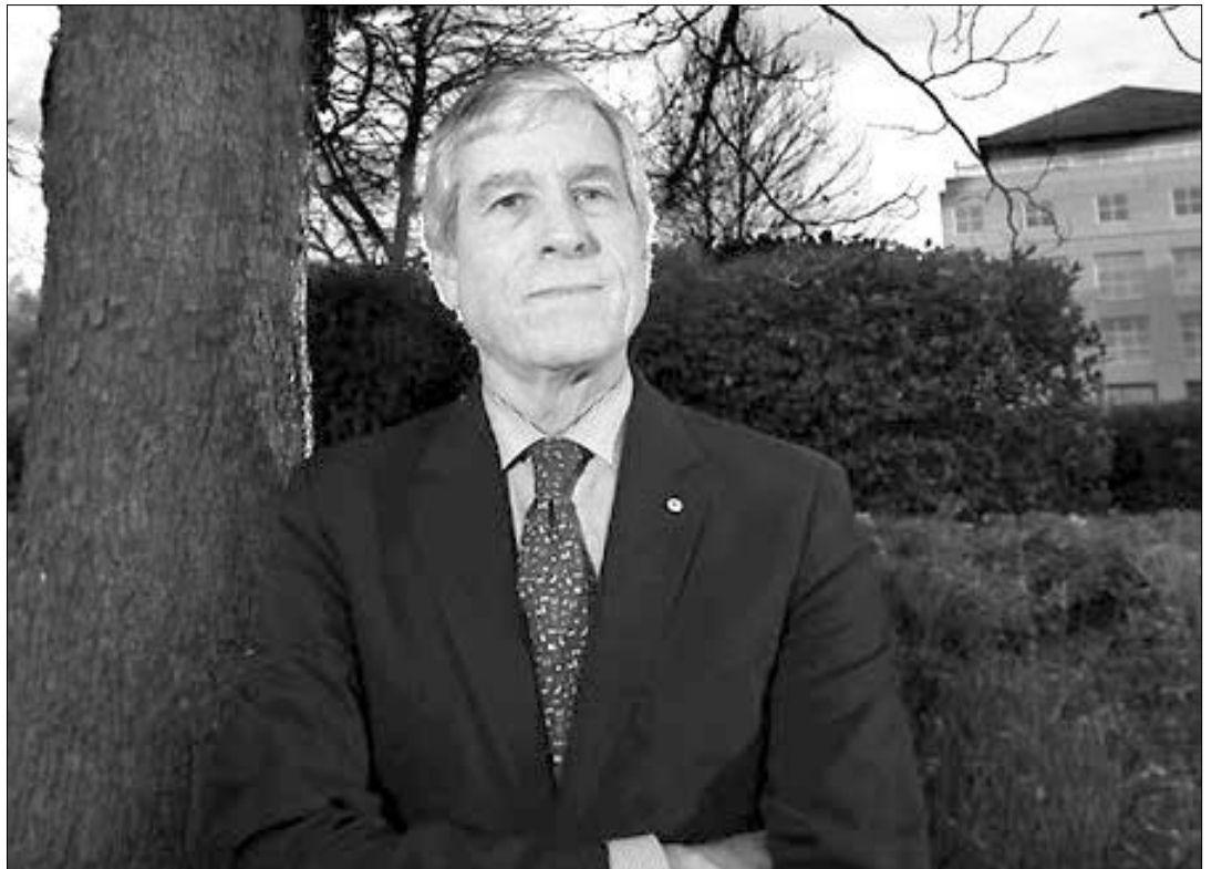
Ο Γενικός Διευθυντής της Αυστραλιανής Μυστικής Υπηρεσίας Πληροφοριών (ASIS), Nick Warner.

Να υπενθυμίσουμε ότι πριν λίγες μέρες ανώτατο στέλεχος της αστυνομίας και 12 άντρες του, πήραν όπλα και αποσκίρτησαν στους Ταλιμπάν στην δυτική επαρχία του Φαρά.