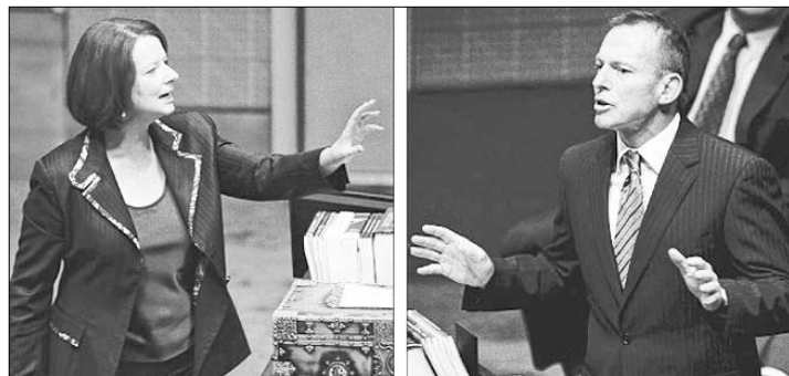
Μεγάλωσε η διαφορά ανάμεσα στη δημοτικότητα του αρχηγού της αντιπολίτευσης, Τόνι Άμποτ και της πρωθυπουργού Τζούλια Γκίλαρντ.

Η τελευταία δημοσκοπήσιση της εταιρίας Newspoll για την εφημερίδα «The Australian» καταγράφει νέα πτώση της ψήφου του Εργατικού Κόμματος στην πρώτη κατανομή και αύξηση του ποσοστού των ψηφοφόρων που αποδοκιάζουν το έργο της πρωθυπουργού. Η ψήφος του Εργατικού Κόμματος στην πρώτη κατανομή έπεσε τρεις μονάδες στο 28%, ενώ την ίδια ώρα η ψήφος του Συνασπισμού Φιλελεύθερων-Εθνικών μειώθηκε δύο μονάδες στο 46%. Ο Συνασπισμός προηγείται σταθερά και στη δεύτερη κατανομή. Μετά τη διανομή των δεύτερων προσημίσεων των άλλων πο-