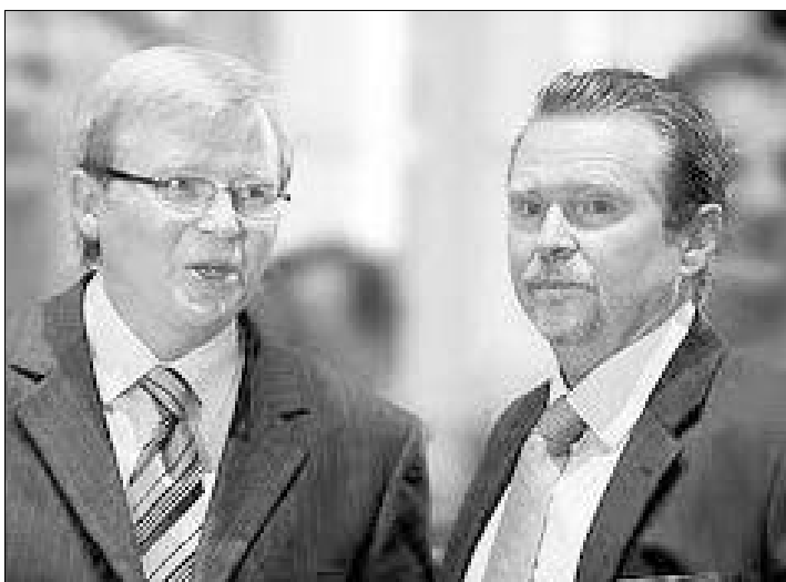
Ο Κέβιν Ραντ με τον αδελφό του Γκρεγκ σε παλιότερο στιγμιότυπο.

Μια θέση στην Γερουσία θα διεκδικήσει στις επόμενες ομοσπονδιακές εκλογές, ο Γκρεγκ Ραντ, αδελφός του πρώην πρωθυπουργού της χώρας, Κέβιν Ραντ. Δημοσιογραφικές πληροφορίες ανέφεραν χθες ότι ο κ. Γκρεγκ Ραντ θα διεκδικήσει ως ανεξάρτητος μια έδρα του Κουίνσλαντ στη Γερουσία, στις εκλογές του 2013. Οι ίδιες πηγές ανέφεραν ότι οι δύο αδελφοί διατηρούσαν στενές σχέσεις παλιότερα, αλλά απομακρύνθηκαν ο ένας από τον άλλο όταν ο Κέβιν Ραντ ανέλαβε την πρωθυπουργία της χώρας.