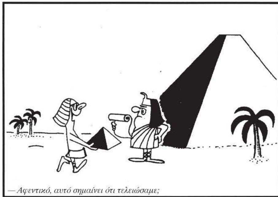
— Αφεντικό, αυτό σημαίνει ότι τελειώσαμε;