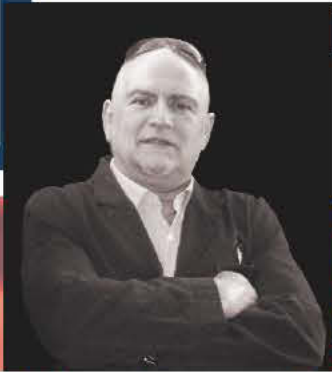
Του Γιώργου Σταυρουλάκη